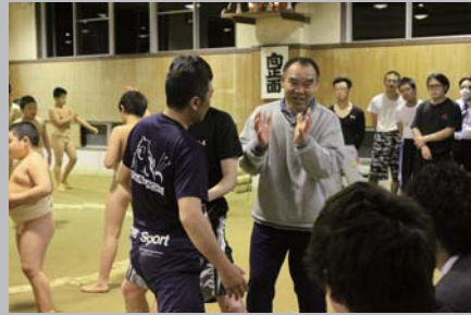
4月担当例会はメンバーみんなで相撲教室へ

そして、今年で32回目になる「わんぱく相撲十日町場所」が十日町市諏訪神社で5月8日に行われました。当日は天候にも恵まれて64名のわんぱく力士に参加していただき、多くの保護者から熱い声援が飛び交い、熱戦が繰り広げられました。