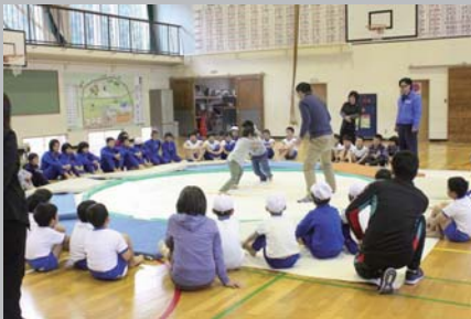
の21校で開催した相撲教室の様子

まずは、3年目になる相撲教室を十日町市、津南町の各小学校21校で行いました。相撲教室では、十日町相撲連盟様のご協力のもと、相撲の楽しさ、礼節を多くの子ども達に学んでいただき、体感してもらいました。