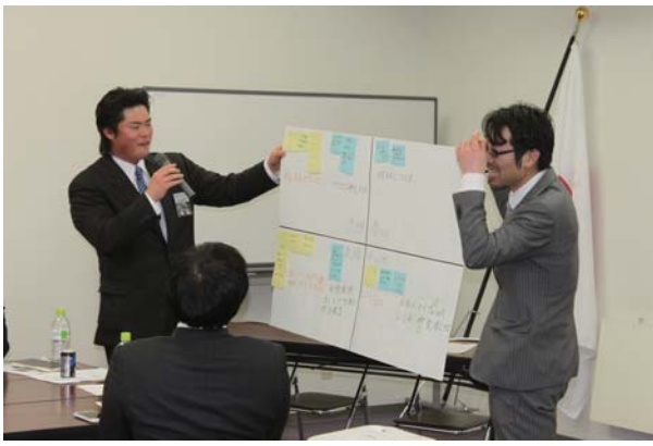
▲3月2日 エコマールにて