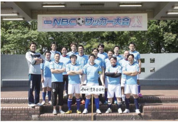
▲5月29日 スポアイランド聖龍にて