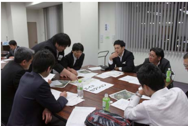
▲6月7日 エコモールにて