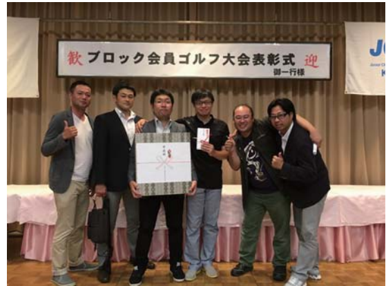
▲6月11日 湯田上カントリークラブにて

6月11日(土)に湯田上カントリークラブにて開催された新潟ブロック協議会の会員ゴルフ大会に参加して参りました。未経験のコースを初対面の他LOメンバーと共にラウンドさせて頂き、準優勝という成績をおさめる事ができました。加えて加茂J.C様の趣向を凝らした設営や人をもてなす手法を学ぶ事ができ、大変貴重な一日となりました。