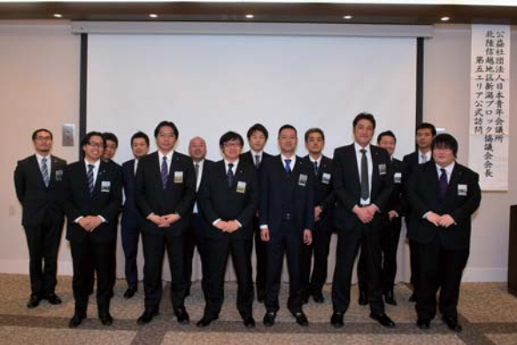
▲3月30日 ホテルオカベにて