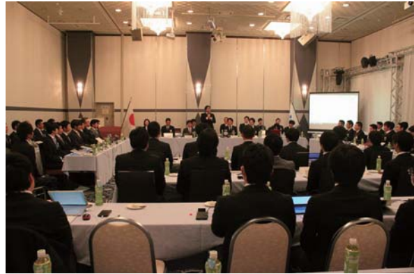
▲3月19日 ラポート十日町にて

昨年はブロック事務局という立場で各地の会員会議所会議に参加させていただきましたが、自LOM開催の会議となるとやらなければいけないことが予想以上に多いというのが正直な感想です。今年は専務が会場手配等を行って下さり手伝い程度しか出来ませんでした。今後この経験を確実に引き継げるようにしたいと思える1日でした。