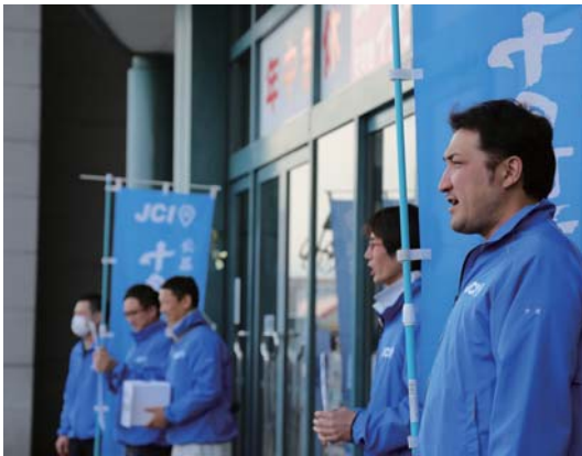
▲4月16日 イオン十日町店前にて