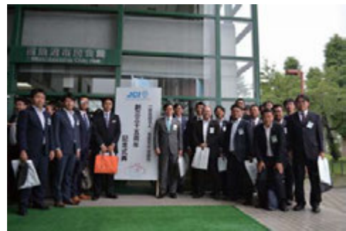
▲8月27日 南魚沼市民会館にて

スタートから魚沼産夢ひかりの歌とダンスを披露する流れで、会場の空気は一つに。その後は歴代理事長をステージ上へあげ、先輩方へ感謝する式典でした。祝賀会ではサプライズゲストの登場で参加者を楽しませる工夫がなされていました。大勢のメンバーが参加し、来年の60周年に向けてよい経験ができたと思います。参加された皆様、お疲れさまでした。