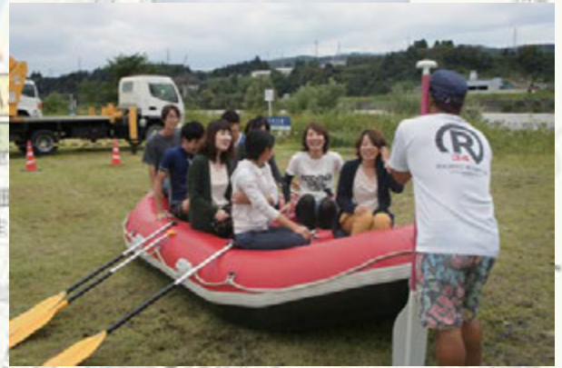
▲残念ながら川の増水により中止になってしまいましたが、事前講習だけでもラフティングに触れていただきました！

この度、9月24日、25日に開催されました、ちいき体感型トライアスロン「ローカルアスロン」を大きな事故や怪我なく無事に終えることができました。当日までの準備、運営を通してメンバーはもとより、企画段階からご相談をさせていただいた皆様、ご協賛いただいた企業様、ボランティアスタッフの皆様、エイドステーションでのご協力をいただいた皆様、本当にありがとうございました。大会直前まで雨が続けて信濃川が増水していたこともあり、残念ながらラフティングは中止となりましたが、当日は秋晴れらしい青空が広がり、とても楽しく素晴らしい一日となりました。