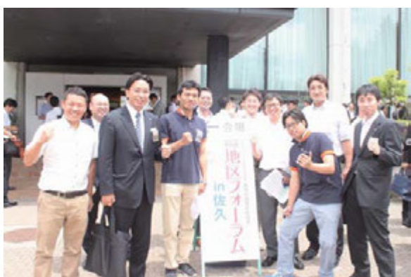
▲7月2日 長野県・佐久創造館にて