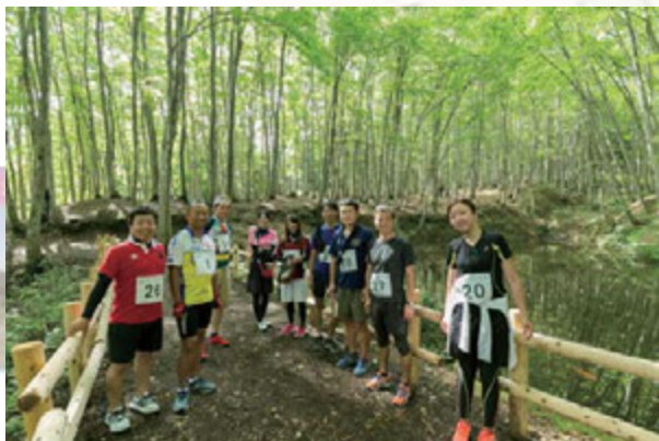
▲バイクを駐めて、美人林でトレッキング