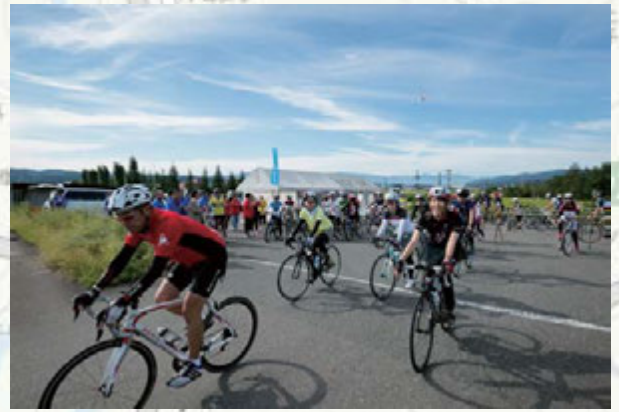
▲つまりっ子ひろばより一斉スタート！