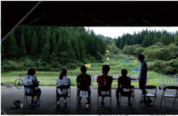
▲農舞台エイドステーションでひとやすみ。。