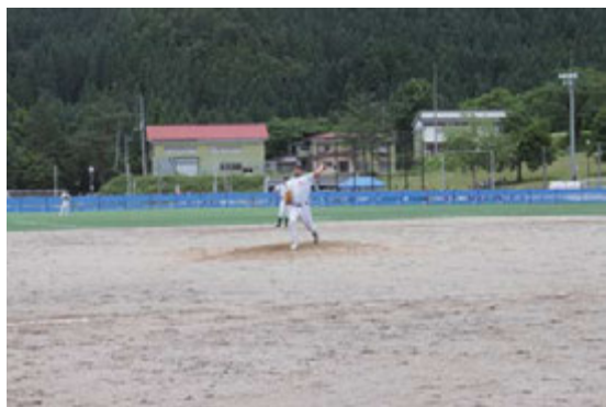
▲6月26日 南魚沼市大原運動公園野球場にて