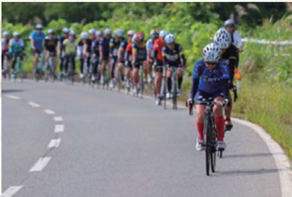
▲坂道を登り抜けて行きます