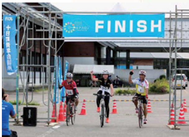
▲ついに FINISH！！ 坂道の多い厳しいコースでしたが みなさん笑顔でゴールしていただきました