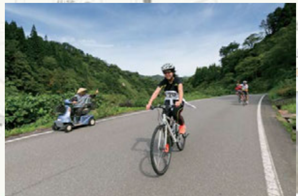
▲おばあちゃんが声援をくれました！