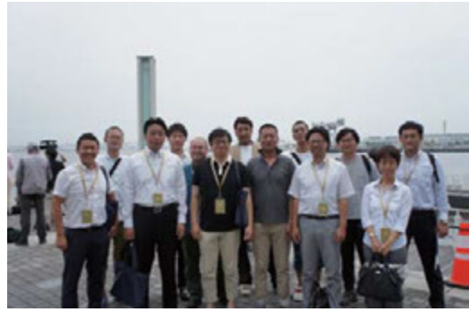
▲7月16日 パシフィコ横浜にて

皆様、お疲れサマコン。という挨拶で始まるサマーコンファレンス特別委員会の第3小委員会に（広報）出向し当委員会の力となるよう、微力ながら行ってまいりました。全国から志を同じとするメンバーが集まり、力を合わせ、成功に向けて尽力していく姿は、とても楽しみながら意気揚々とした雰囲気の中にも何か洗練された人間性が垣間見えました。