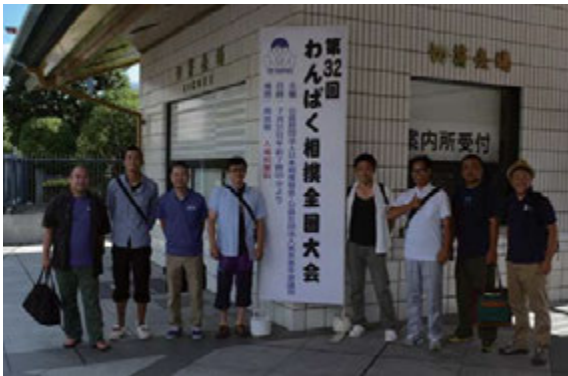
▲7月31日 両国国技館にて