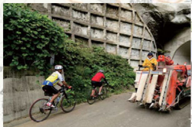
▲コンバインとすれ違うのもまた、ローカル